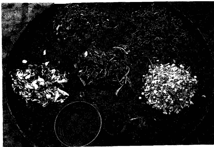
สมุนไพโรกิล้ยุง มีผิวมะกรูด เปลือกต้นสะเดา เปลือกต้นอีเหม็น เปลือกต้นฐูป ตะไคร้หอม ข่า และน้ำตะไคร้หอม

วิธีการทำนั้นก็ไ้ยุงยาก อุปกรณ์ ที่ใช้ในการผลิตก็ล้วนมาจากในครัวทั้งสิ้น แต่อาจต้องใช้ฝีมือในการปั้นฐูปซักหน่อย งบ ประมาณก็ไ้้น้อยซึ่งส่วนใหญ่เป็นค่าแรง “ในช่วงแรกที่เรากทำกันนั้นเรายังไม่มีเครื่อง บดเรากก็ใช้ครกหินมาตำสมุนไพโรกิล้